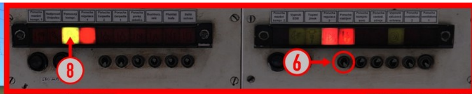
Kontrolleuchten über dem Frontfenster