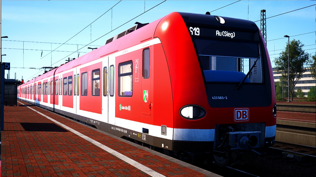
◦ Version 2