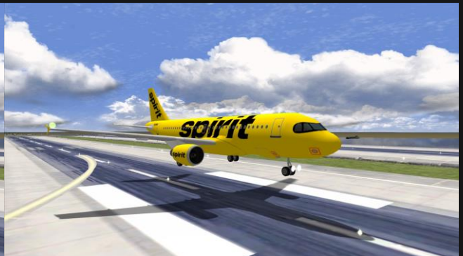
A320neo Spirit Airlines