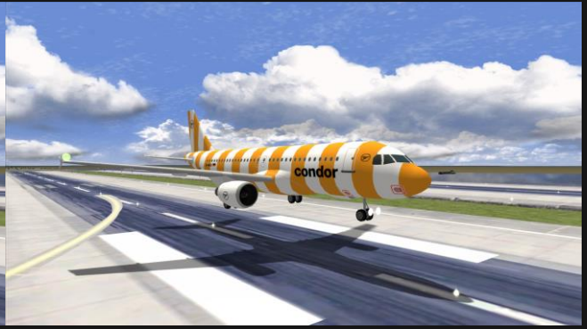
A320 Condor (Sunshine)