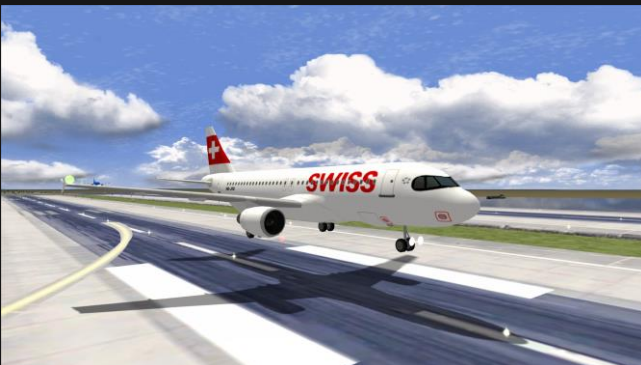
A320neo Swiss Int. Air Lines