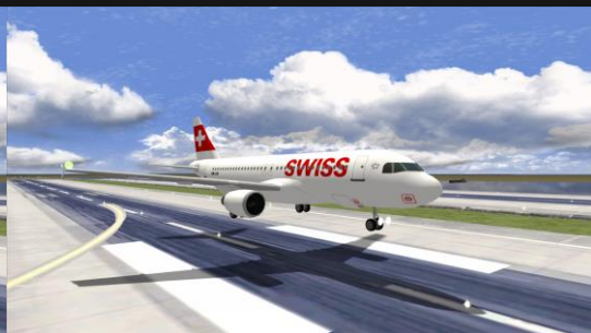
A320 Swiss Int. Air Lines