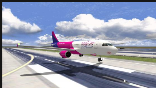
A320 Wizz Air (V2500)