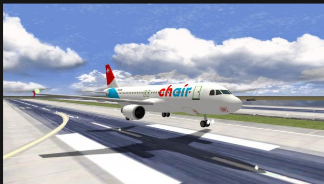
A320 Chair Airlines