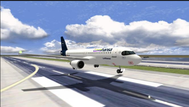
A320neo Lovehansa (Lufthansa)