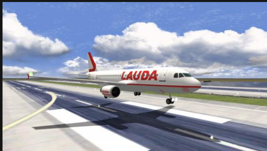
A320 Lauda Europe