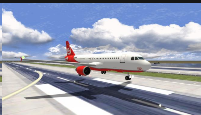
A320 SundAir (ex. Airberlin)