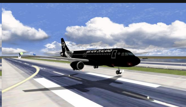
A320 Air New Zealand (V2500)