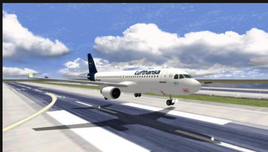
A320 Lufthansa new livery