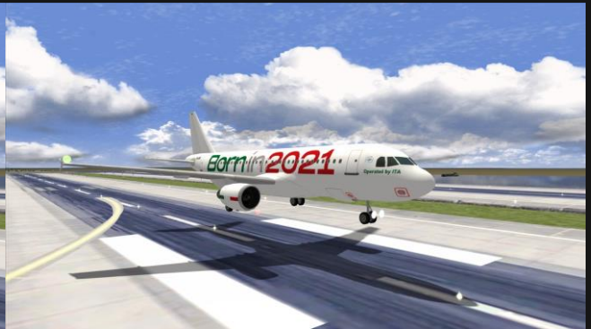
A320 ITA Airways "Born in 2021"