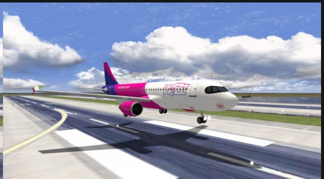
A320neo Wizz Air