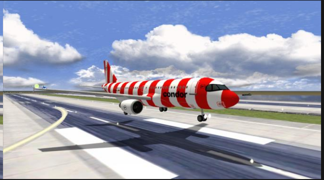
A320neo Condor (Passion)