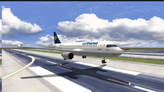
A320 Lufthansa old livery