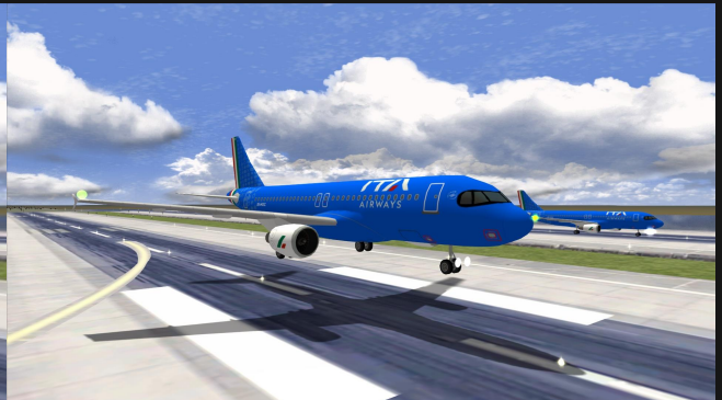
A320neo ITA Airways